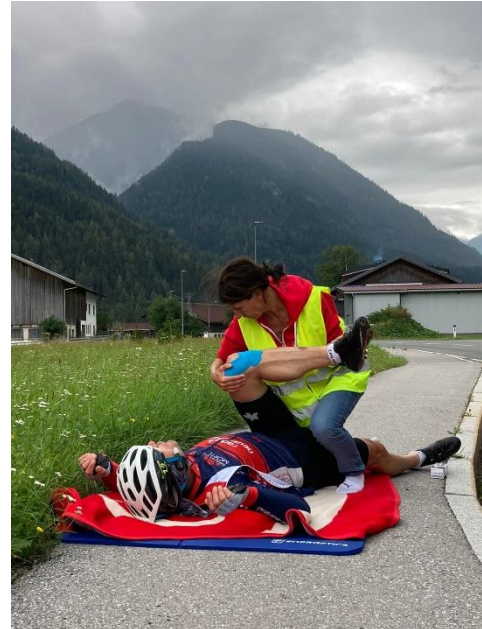
ein Versuch mein Knie zu lindern

Doch plötzlich mischte sich mein linkes Knie in das Geschehen ein und zerstückte buchstäblich meine Fantasien wie einen Luftballon: ein stechender, massiver Schmerz begleitete jede Kurbelumdrehung! Wir probierten was uns auch immer alles zur Verfügung stand. Irgendwie brachte mich meine Crew über den letzten Hügel zum Wohnmobil, welches nach der Grenze zu Tirol auf uns wartete. Massieren, dehnen, tapen, schmieren, gut zureden, fluchen, beten oder einbeinig fahren: alles wurde probiert. Alles mit dem Ergebnis, dass nach kürzester Zeit das Knie jede Bewegung mit einem Stich quittierte. Eine Tablette (selbstverständlich haben wir die NADA App befragt!) welche meiner Schwester entwendet wurde, verschaffte mir zumindest 3,5h Fahrzeit. Ich begann wieder mit einer Hochrechnung. Diesmal aber nicht die Zielzeit, sondern den Tablettenbedarf ... Meine Crew hatte da aber andere Pläne. Das ich nicht mit regelmäßigen Tablettenkonsum weiter fahre wurde mir unmissverständlich erklärt. Stattdessen mobilisierte das Team jede mögliche Quelle um Informationen zu bekommen. Da wurden der Freund vom Freund eines Freundes nachts angerufen, Verwandte befragt und bei den Crewmitgliedern Erlerntes - aber wieder Vergessenes - in Erinnerung gerufen. Wohlgesonnene wurden um positive Energie gebeten und ich bekam immer wieder Zuspruch von meinem Team.