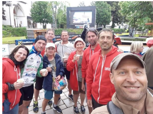
116 Stunden später

Nun kam der Teil, welcher für vieles entschädigt: Die letzten Kilometer! Alle Knie- und sonstige Schmerzen lösten sich in Luft auf. Energie zum Treten war scheinbar endlos vorhanden. Meine Crew versorgte mich mit passender Musik und am Streckenrand feuerte uns das Publikum an. Emotionen begannen zu steigen. Von einem Begleitfahrzeug persönlich abgeholt fuhren wir der Ortstafel, und damit dem langersehnten Ziel entgegen. Ich weiß davon nicht mehr viel: Aber die Gänsehaut hatte ich Tage danach noch immer! Die ganze Anspannung viel von mir ab, stattdessen nahm ich all die Emotionen und Gefühle in mich auf! Zur offiziellen Ankunft auf der Bühne waren dann alle Crewmitglieder da und gemeinsam konnten wir beenden, was wir gemeinsam bestritten. Ein Gefühl, welches ich mit meinem Wortschatz wiederzugeben nicht vermag!