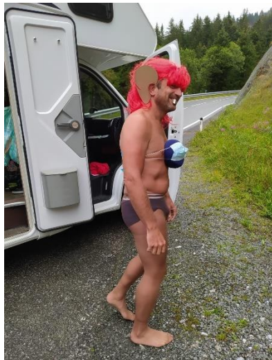
die Motivation meines Teams