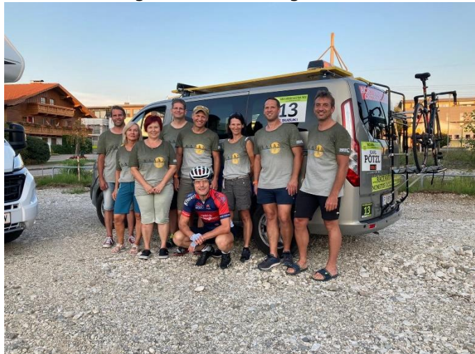
Das weltbeste Team