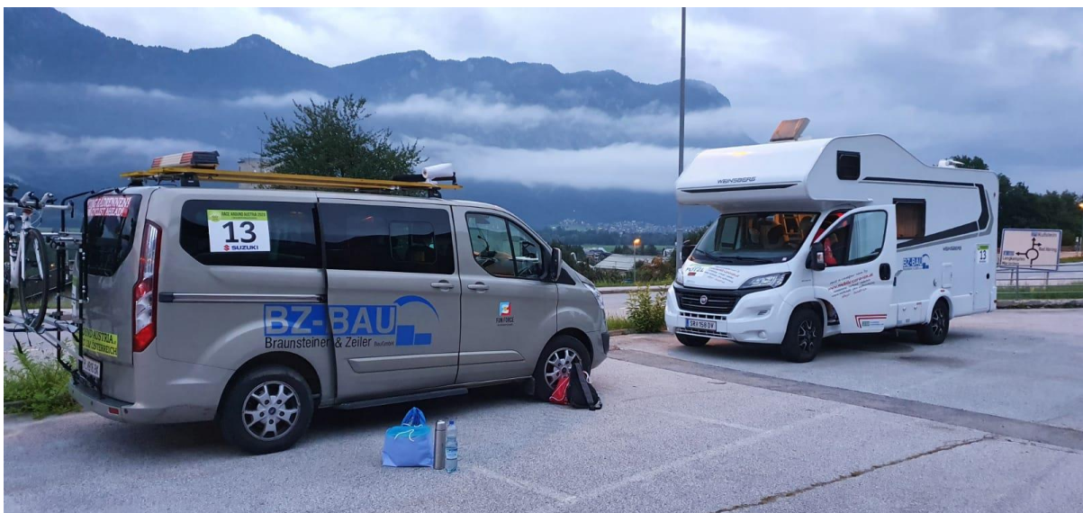
unsere motorisierte Fortbewegung

Dann war sie da: Die letzte Woche vor dem Start! Ich wurde ein klitzekleinwenig unlocker. Meine Kraft und Energie sank spürbar, dafür stiegen die Zweifel und Ängste massiv. Schwerste Bedenken manifestierten sich in mir: Wie konnte ich das meinem Team nur antun? Was, wenn es mir so wie vor 5 Jahren ergeht und ich aufgeben muss? Ich holte mir ein wenig Zuspruch und Mut, aber vergebens. Am Tag vor dem Start nahm ich das Telefon in die Hand, um mein Team von meiner Absage zu informieren. Ich konnte nicht! Bereits bevor ich noch begonnen hatte war ich fertig! Mit den Leit- und Motivationssätzen, die ich mir eigentlich für das Rennen zurechtgelegt hatte, konnte ich diese Phase überwinden – ich rief mein Team nicht an. Dass ich aber meine Notfall-Karte, die Motivationssätze, bereits VOR dem Rennen benötigen würde, damit habe ich nicht gerechnet.