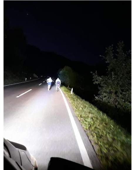
unser Licht am PaceCar

Dann war sie da: Die letzte Woche vor dem Start! Ich wurde ein klitzekleinwenig unlocker. Meine Kraft und Energie sank spürbar, dafür stiegen die Zweifel und Ängste massiv. Schwerste Bedenken manifestierten sich in mir: Wie konnte ich das meinem Team nur antun? Was, wenn es mir so wie vor 5 Jahren ergeht und ich aufgeben muss? Ich holte mir ein wenig Zuspruch und Mut, aber vergebens. Am Tag vor dem Start nahm ich das Telefon in die Hand, um mein Team von meiner Absage zu informieren. Ich konnte nicht! Bereits bevor ich noch begonnen hatte war ich fertig! Mit den Leit- und Motivationssätzen, die ich mir eigentlich für das Rennen zurechtgelegt hatte, konnte ich diese Phase überwinden – ich rief mein Team nicht an. Dass ich aber meine Notfall-Karte, die Motivationssätze, bereits VOR dem Rennen benötigen würde, damit habe ich nicht gerechnet.