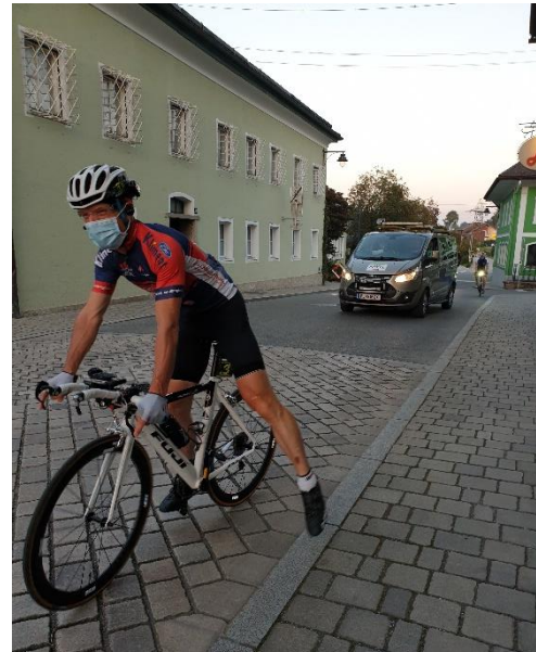
mit Maske: eindeutig 2020 zuzuordnen